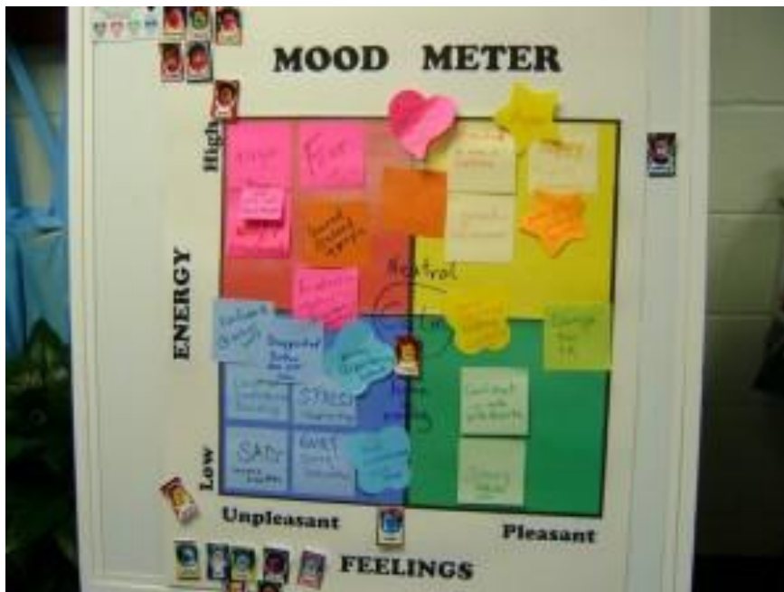
Schema Mood Meter per alunni

Come si vede dall'immagine sopra, si tratta di un grafico cartesiano che ha sull'asse delle x le sensazioni, divise in piacevole e sgradevole, e sull'asse delle y l'energia, divisa tra bassa e alta.